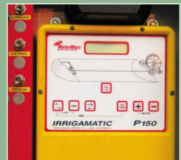
Painel eletrônico de controle de velocidade